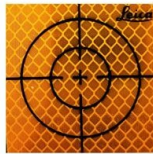
ขนาด 6X6 CM